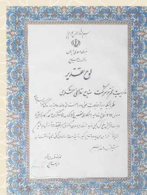
لوح تقدیر وزارت صنایع سال ۱۳۷۳

Now, after several decades have passed since the start of this family business by him, we are still continuing the path and we are trying to preserve the tradition and quality and invent newer products with good taste and feel. We would like to see your happiness.