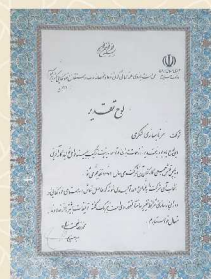
لوح تقدیر وزارت صنایع سال ۱۳۷۱